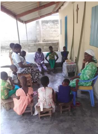
Prière du dimanche 5 avril

Dans le cadre de l'année 2019-2020, les marraines et les parrains ont spontanément donné leur part de contribution. Encore une fois, nous tenons à leur adresser tous nos remerciements pour la fidélité et la bienveillance. À ce jour, il nous manque deux retours des parrains de 2018. ESTOGO s'engage à compenser le manque, en attendant de trouver de nouvelles âmes généreuses.