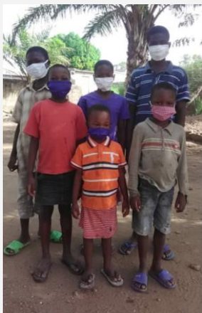
Les petits orphelins respectent les gestes barrières

Ici de nombreuses personnes interpellent les membres de l'association ESTOGO, pour savoir comment la crise du Covid 19 se vit au TOGO ou en Afrique : Au 8 juin, on dénombre 497 cas confirmés, 251 guérisons et 13 décès.